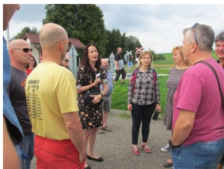
Paňi místostarostka odpovídá na dotazy