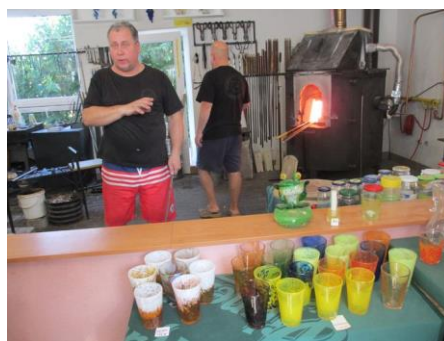
Návštěva sklářské huti