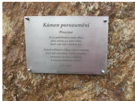
Nápis na Kameni porozumění