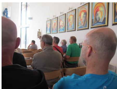
Křížová cesta v kapli v Sázavě