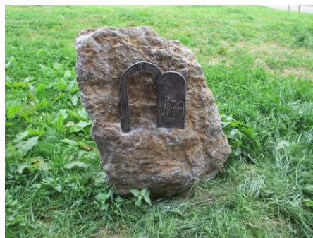
Zastavení na Cestě života