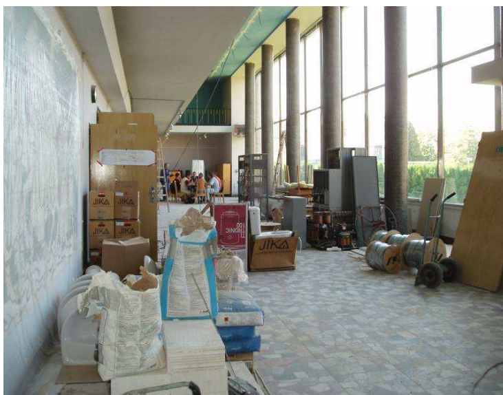
Kulturní dům Příbryslav – rekonstrukce elektroinstalace a elektroakustiky