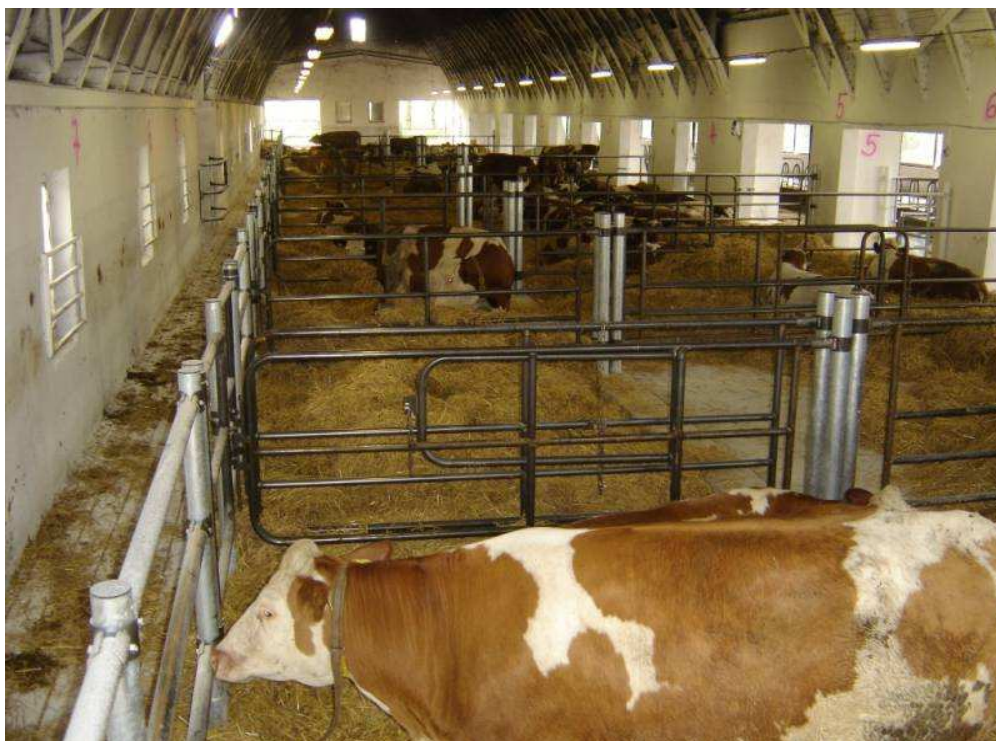
Krucemburk – porodna krav