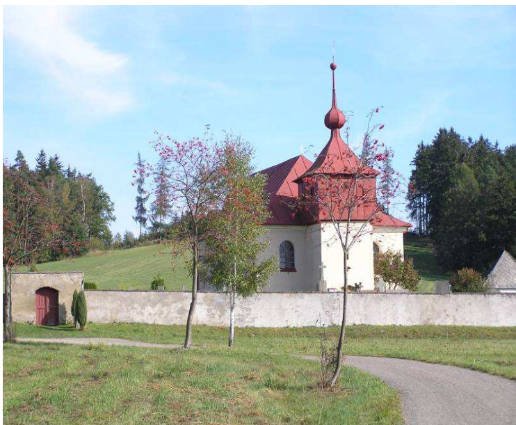
Rekonstrukce kostela sv. Kateřiny Alexandrijské ve Stříbrných Horách