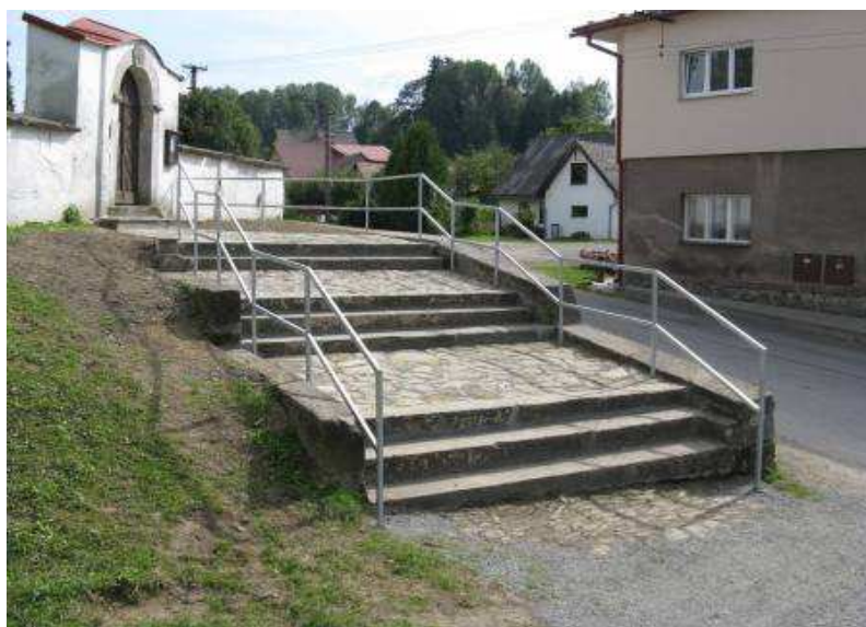
Rekonstrukce přístupové cesty k památkově chráněnému areálu kostela sv. Václava v H. Studenci