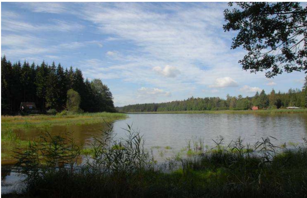
CHKO Žďárské vrchy, rybník Januš - Stružinec