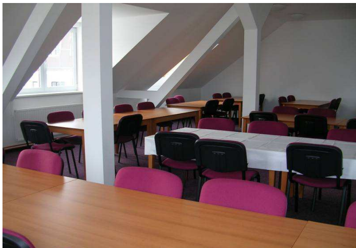
Požární zbrojnice Havlíčkova Borová – prostor pro klubovou činnost