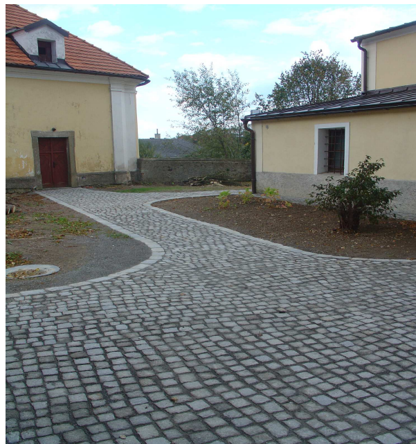
Příbyslav – úprava cestní sítě v okolí kostela Narození sv. Jana Křtitele