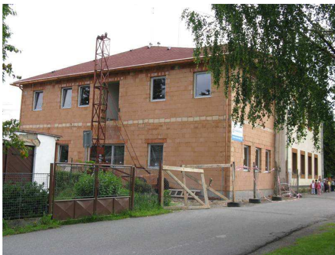
Přístavba multifunkčního sálu se zázemím k MÚ Ždírec n.D.