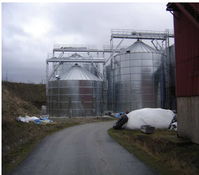
Technologie skladu obilovin – Zemědělská a.s. Krucemburk