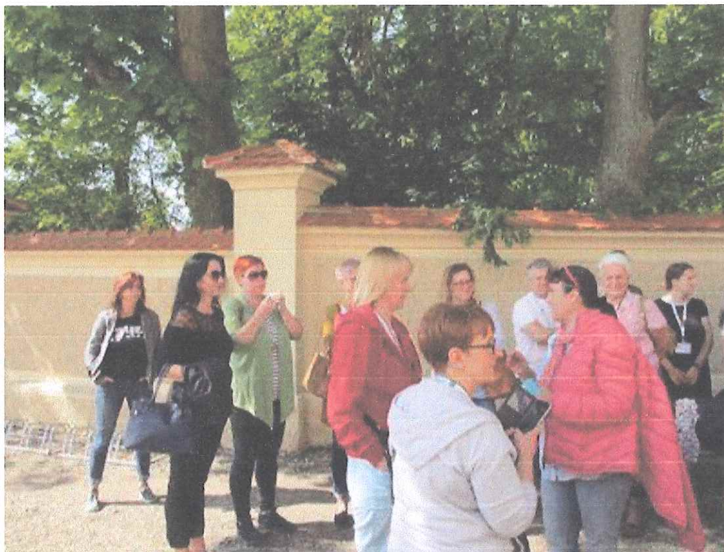
Ohlédnutí za setkáním MASEk v Žatci při Leaderfestu 2019 – výměna zkušeností

Veškeré celostátní plánované akce – Leaderfest 2020, Konference Venkov 2020, společná setkání a semináře, byly v důsledku nouzového stavu (koronavirus 19) zrušeny. Zůstala nám pouze on-line setkání.