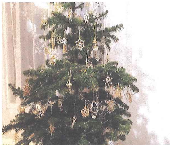
Vítězný stromeček z Místní knihovny Sobiňov

Jedenáctý ročník výstavy „Bez stromečku nejsou Vánoce“ se uskutečnil v prostorách Galerie Doubravka ve Ždírci nad Doubravou. Výstavy se zúčastnilo 13 obcí, které dodaly 14 stromečků. Návštěvníci vybírali pouze jeden stromeček, odevzdali více než 500 hlasovacích lístků. Vítězem se stal stromeček z Místní knihovny Sobiňov s počtem 83 hlasů, na druhém místě se umístil stromeček ze ZŠ a MŠ Sobiňov, s počtem 77 hlasů a na třetím místě stromeček MŠ Vatín s počtem 71 hlasů. Gratulujeme vítězné obci, děkujeme za účast všem ostatním a budeme se těšit na 12. ročník, který proběhne v roce 2020 v Sobiňově. Všem organizátorům ze Ždírci nad Doubravou a všem zapojeným obcím děkujeme.