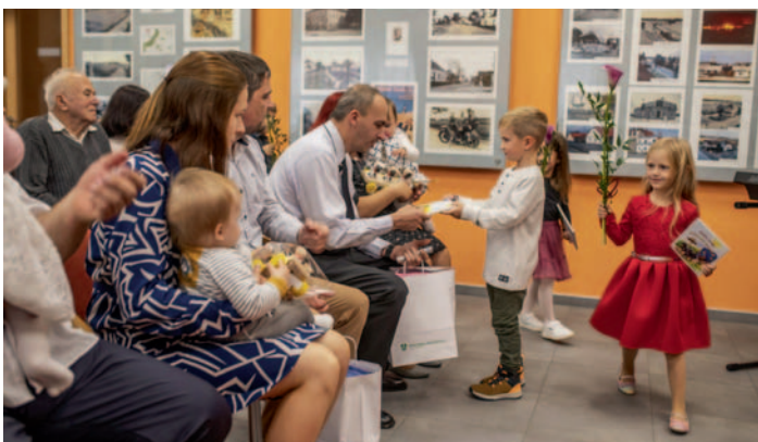
Vítání občánků, str. 1