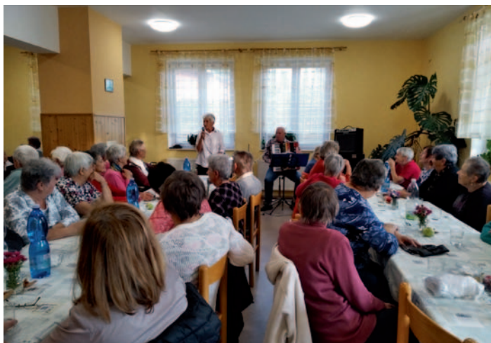
Klub seniorů – Podzimní posezení s písničkou 10. 10. 2023