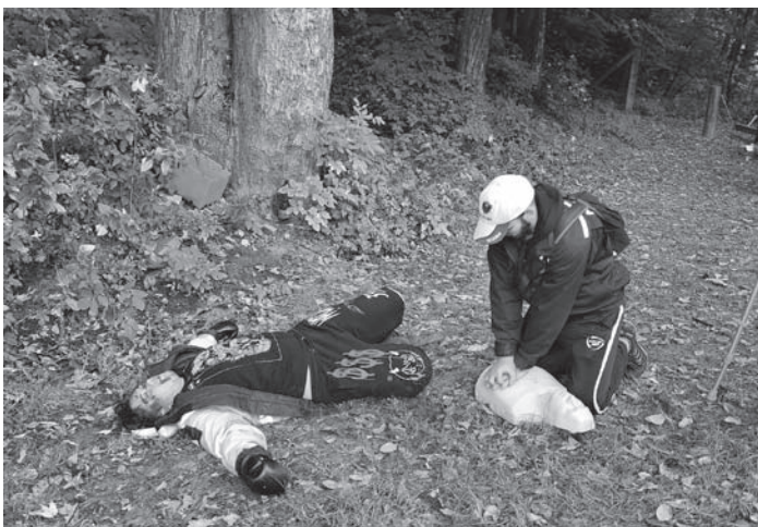
Zásah na Rescue Marathonu