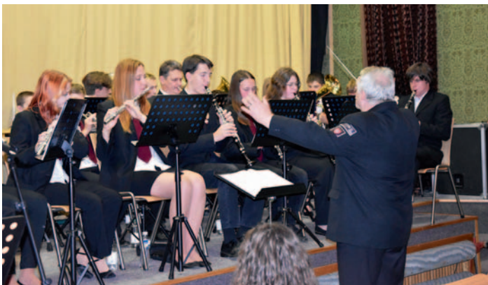
Koncert Dechového orchestru mladých, str. 2