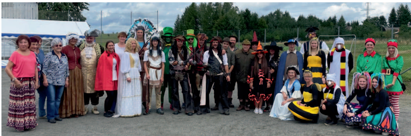
Pohádkový les Kohoutov, str. 13