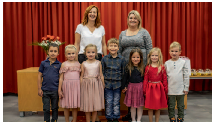
Vítání občánků, str. 1