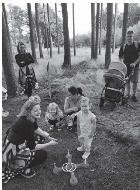
Pohádkový les Kohoutov