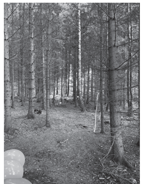
Pohádkový les Kohoutov