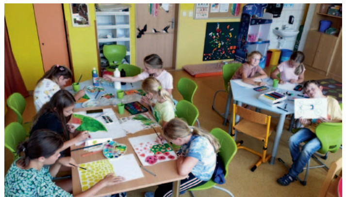
Školní družina Ždírec n. D.