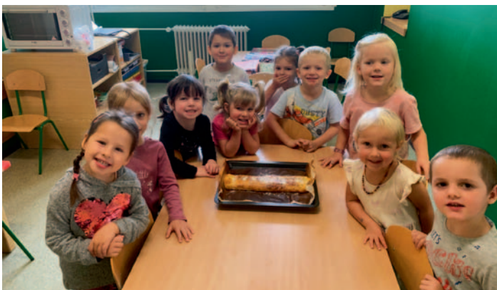
Mateřská škola Ždírec n. D., třída Koťátek