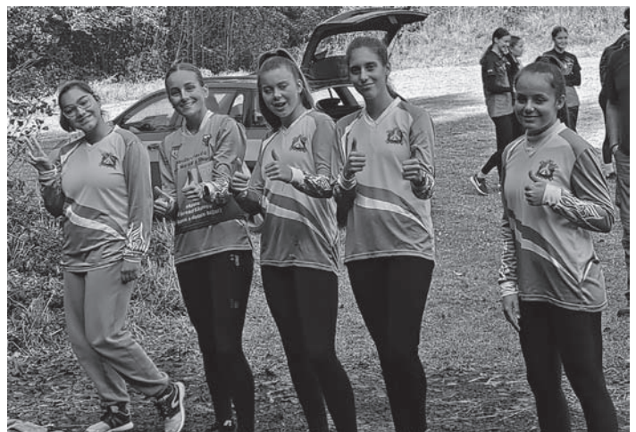
Na startu krajského kola ZHVB