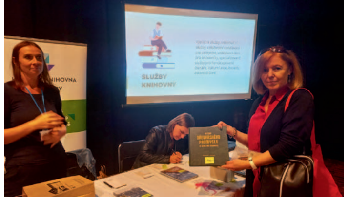
Knižní veletrh 6. 10. 2023, str.2