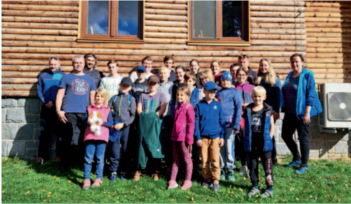
Mladí hasiči Ždírec n. D. – soustředění na Seči, str. 24