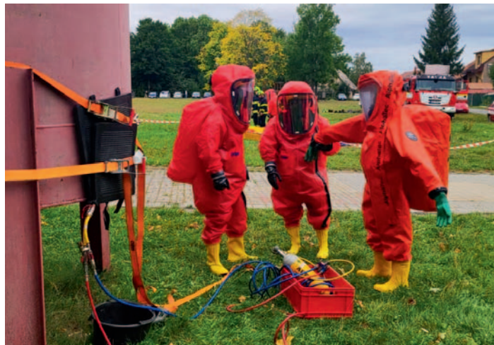
JPO II – Taktické cvičení Chotěboř, str. 23