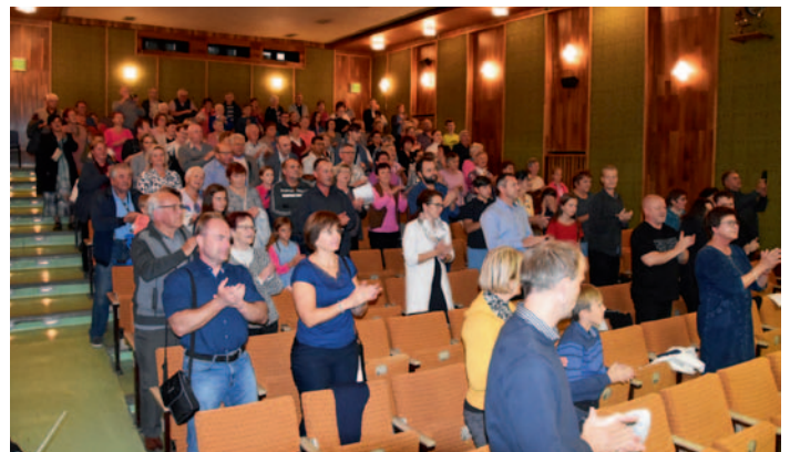
Koncert Dechového orchestru mladých, str. 2