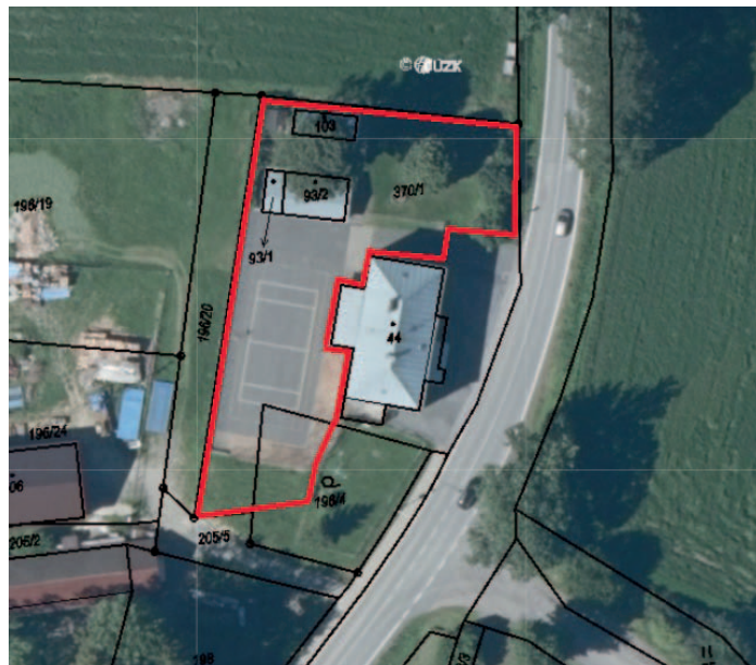
Zákaz vstupu se psy na sportovní areál a dětské hřiště Údavy