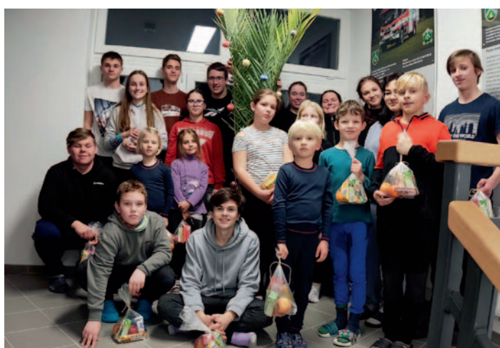
Mladí hasiči Ždírec n. D. – předvánoční přespání, str. 19