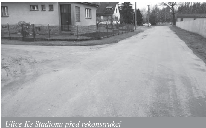
Ulice Ke Stadionu před rekonstrukcí