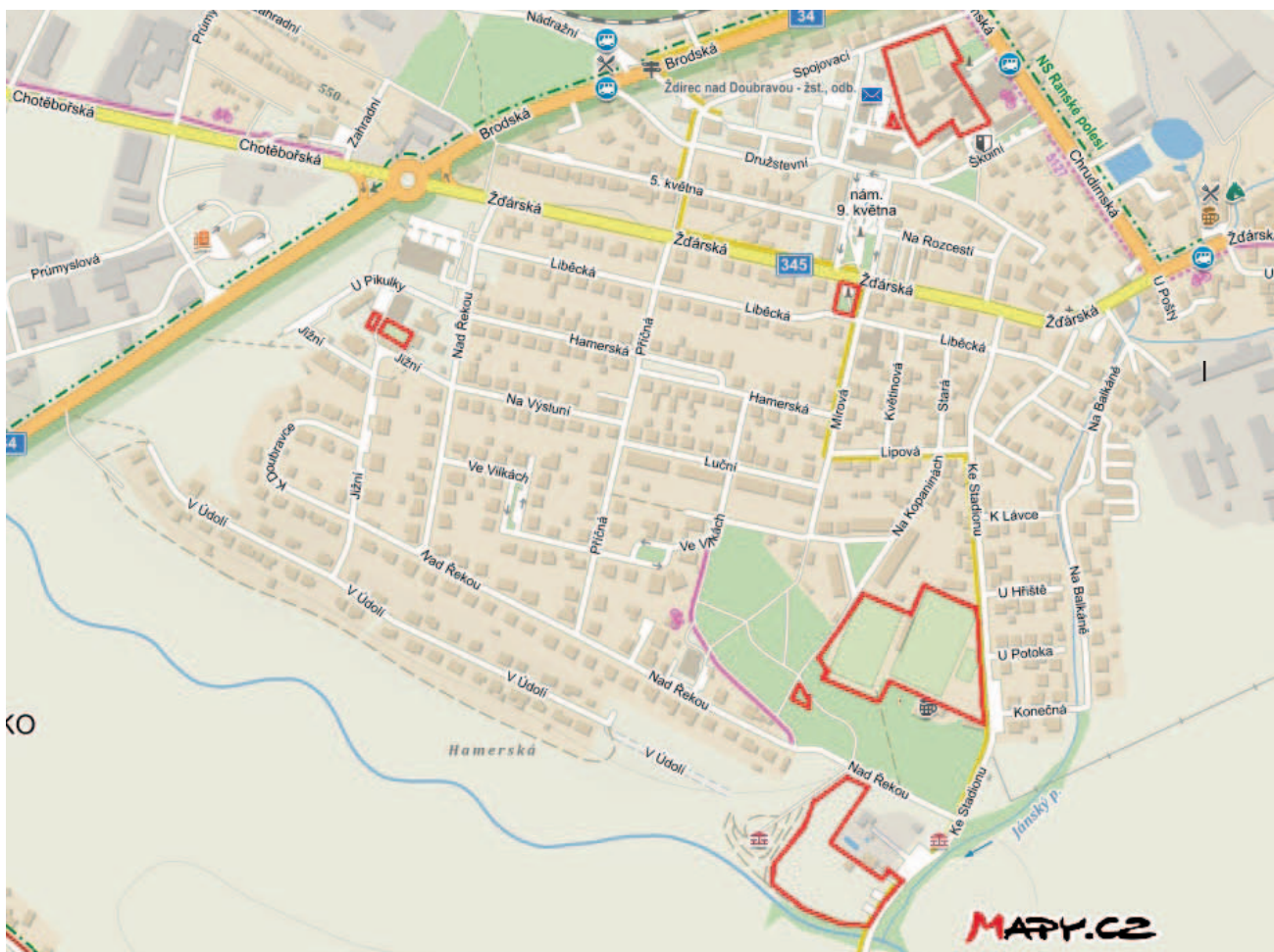
Zákaz vstupu se psy Ždírec nad Doubravou

Kulturní zařízení města Ždírec nad Doubravou