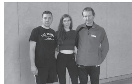
Tatrán team 28. 12. 2022 Ronov n. D.