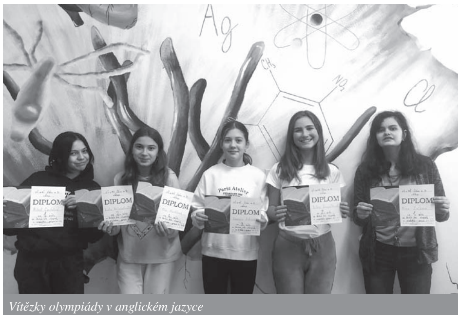
Vítězky olympiády v anglickém jazyce