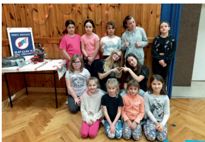
SPV Předvánoční cvičení žákyň, str. 21