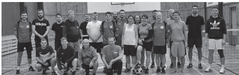
Vánoční turnaj v nohejbalu 17. 12. 2022