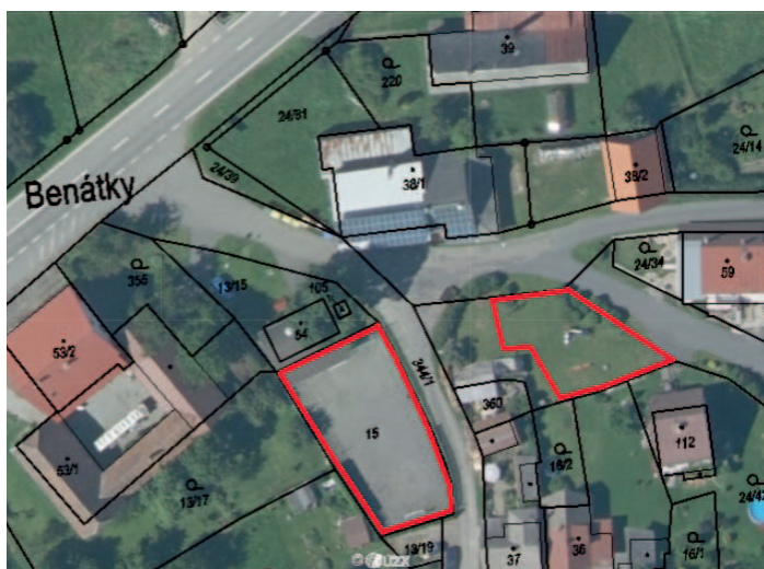
Zákaz vstupu se psy na sportovní areál a dětské hřiště Benátky