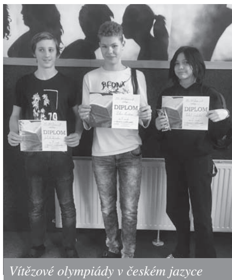
Vítězové olympiády v českém jazyce

Školní kolo olympiády v anglickém jazyce Ve středu 7. prosince proběhlo školní kolo olympiády v anglickém jazyce. Toto kolo mělo dvě kategorie: pro žáky do sedmých ročníků a pro žáky osmých a devátých ročníků. Olympiáda měla tři stanoviště: poslech, popis obrázku, rozhovor.