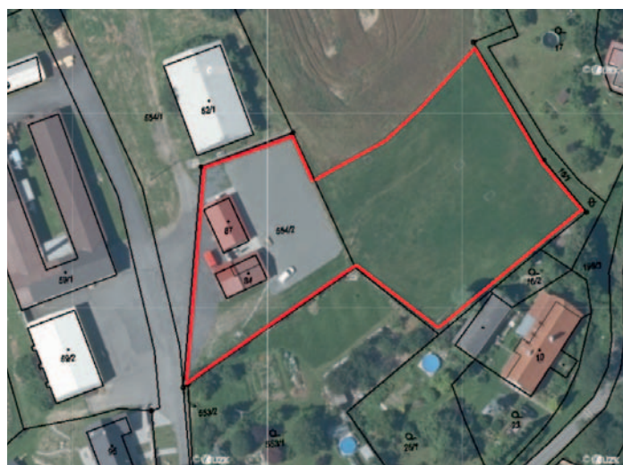
Zákaz vstupu se psy na hasičské hřiště Kohoutov