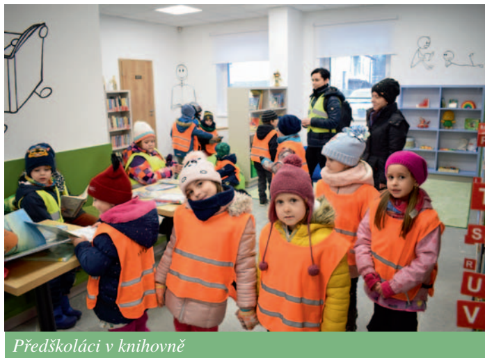
Předškoláci v knihovně