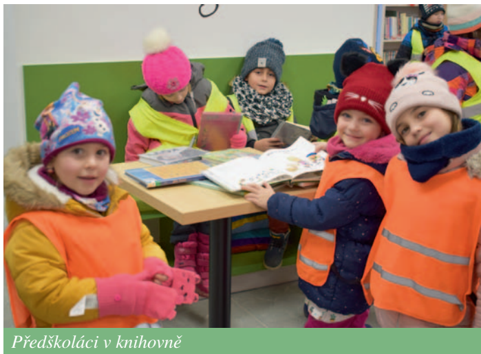
Předškoláci v knihovně