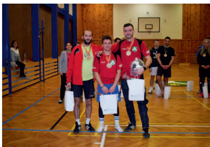
Vánoční turnaj v nohejbalu, vítězné družstvo, str. 22