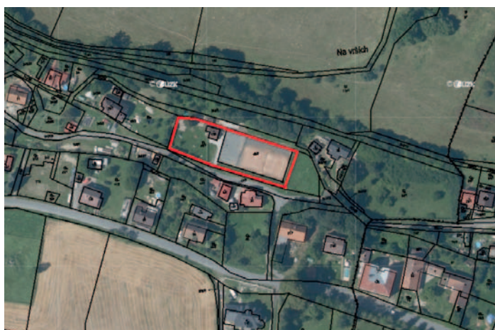
Zákaz vstupu se psy na sportovní areál a dětské hřiště Nový Studenec