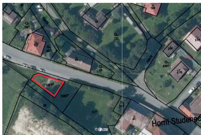
Pomník Horní Studenec (par. č. 708/47 v k. ú. Horní Studenec) Zákaz vstupu se psy