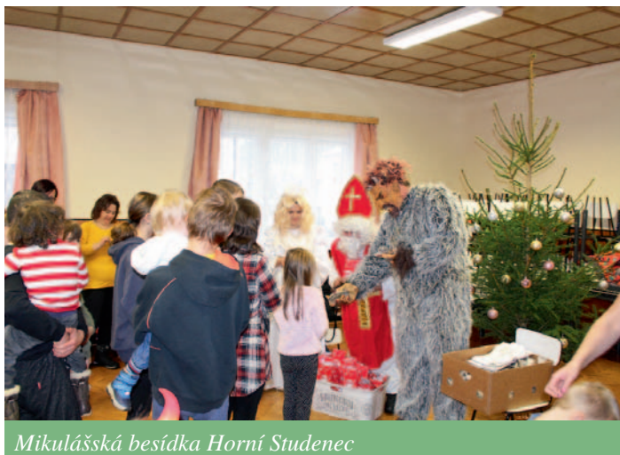
Mikulášská besídka Horní Studenec