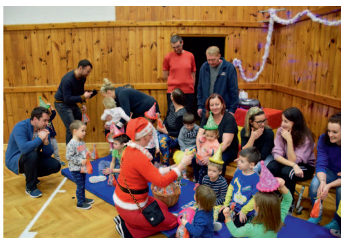
SPV Cvičení rodičů a dětí, str. 22

Naše noviny – periodický tisk územního samosprávného celku. Měsíčník občanů Ždírc nad Doubravou a místních částí. Vydává Město Ždírec nad Doubravou, Školní 500, 582 63 Ždírec nad Doubravou, IČ: 00268542. Redakční rada: Anna Horáková (hlavní jazyková korektura), Jana Uchytílová, Dana Vavroušková, Ing. Nela Niklová, Mgr. Hana Lédlová (počítačový přepis, inzeráty). Předseda: Zdena Lédlová (počítačový přepis). Podepsané články vyjadřují názory autorů a nemusí být totožné se stanoviskem redakce a vydavatele. Redakční rada si vyhrazuje právo příspěvků krátiť a upravovat, tiskové chyby vyhrazeny. Adresa redakce: MÚ Ždírec n. D., Školní 500, 582 63 Ždírec n. D., tel.: 569 694 620, e-mail: knihovna@zdirec.cz; mesto@zdirec.cz. Elektronický archiv NN: http://www.zdirec.cz/ . Evidenční číslo MK ČR E 22668. Náklad 1340 výtisků. Grafická úprava, sazba a tisk Unipress Žďár n. S.