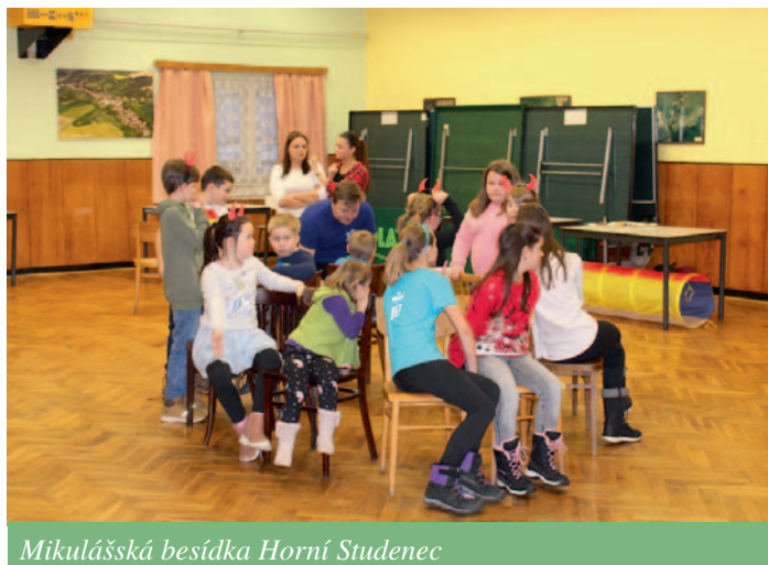
Mikulášská besídka Horní Studenec