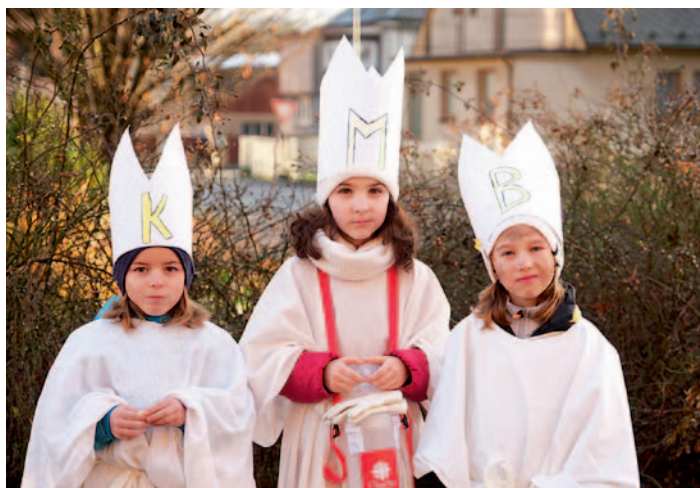
Tříkrálová sbírka Ždírec nad Doubravou, str. 3