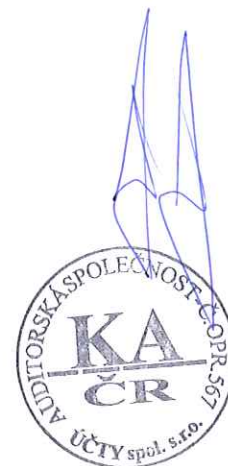
Jitka Škaredová účetní

Havlíčkův kraj, o.p.s. Školní 500 582 63 Žďárec nad Doubravou IČ: 27493245